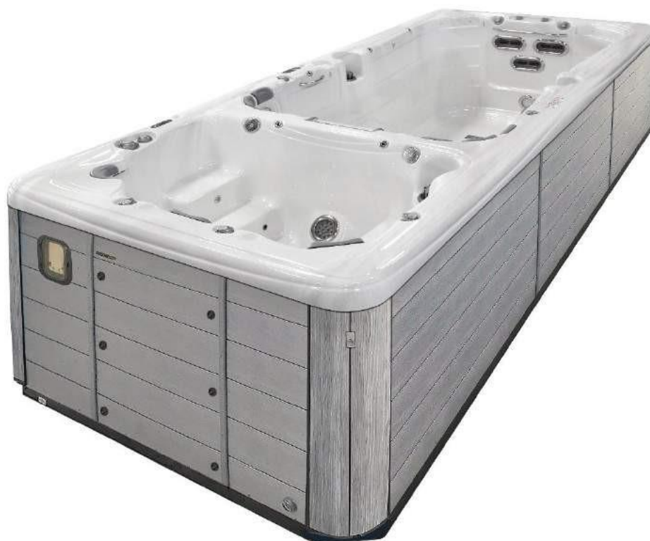
Modèle de jupe présente sur AQUEX 19 (Idem pour AQUEX 17 et 13)